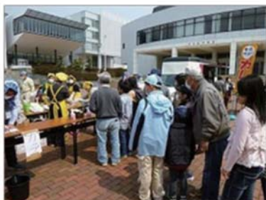
いわき市内での炊き出し

また、松戸市に居住している被災者の方への支援として、生活必需品（布団、食器、台所用品、収納家具など）や自転車の提供、子どもへの学習支援、地元の電器店のネットワークによる中古電化製品の収集提供、千葉県弁護士会と被災者をつなげる原発補償の相談会や税理士会と被災者をつなげる税金の免除申請に関する相談会の開催などの活動を行っています。