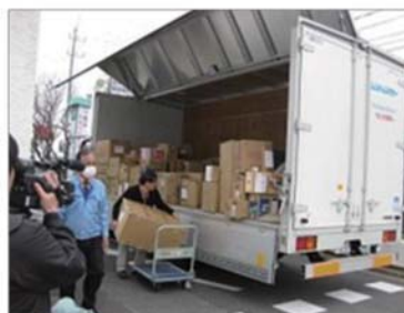
支援物資の積み込み作業