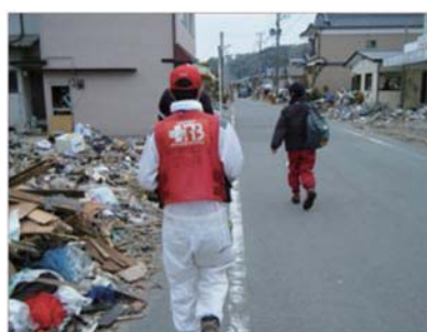
被災地内での復旧支援活動