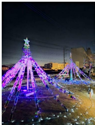
▲素敵な作品が 集まりました！