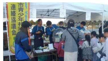
▲好きな色を選んで作る 「カラフルわたあめ」