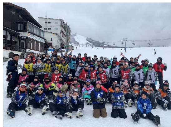
スキー交流教室の集合写真

スキー交流教室に参加した児童・生徒の感想には「来年も参加したい。スキー交流教室の集合写真達げできた」という声も多く、相談員も主催者としてやりがいのある事業です。