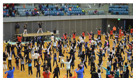
青少年相談員 50 周年記念ダンスイベント