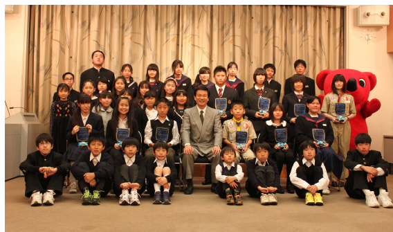
ライトブルー少年賞表彰式