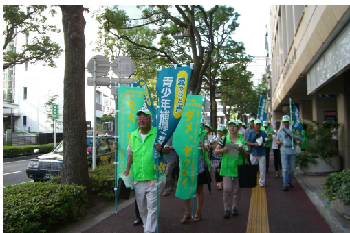
県下一斉合同パトロール (千葉市青少年補導員連絡協議会)