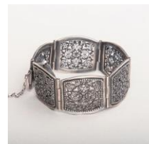
唐草ブレスレット