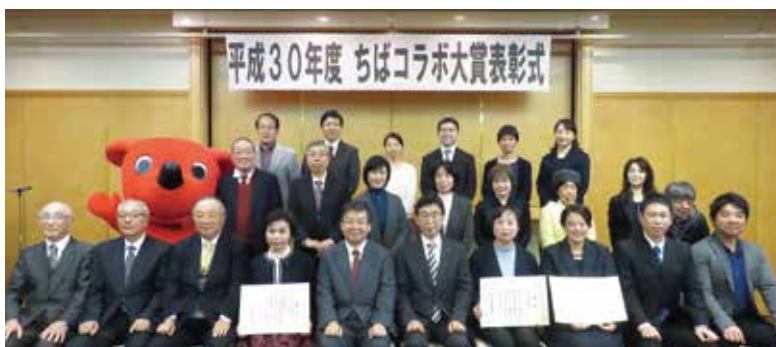
表彰事例記念写真の様子