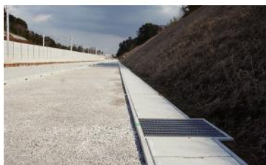
浸透柵の設置例（印西市瀬戸）