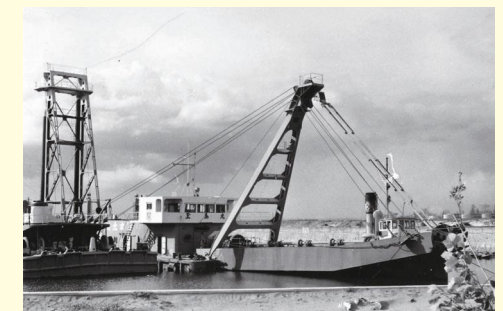
海底の土砂をすくい取る浚渫船 Dredger to scoop up the earth and sand on the seabed