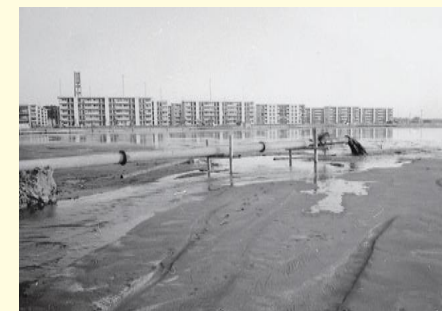
埋立風景 Landscape of landfill