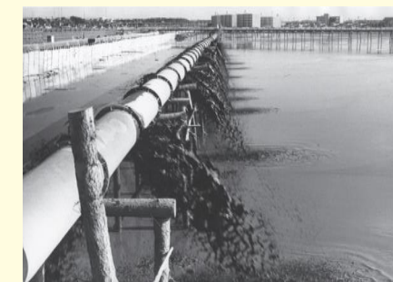
埋立土砂を運ぶ送泥管 Mud pipe that carries landfill sediment