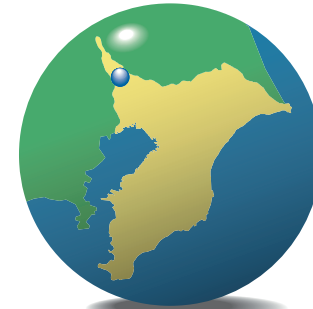
柏の葉キャンパス駅周辺 Kashiwanoha campus station area