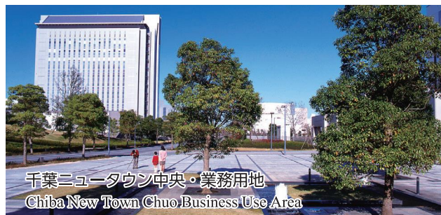
千葉ニュータウン中央・業務用地 Chiba New Town Chuo Business Use Area

Chiba New Town Chuo Area is directly connected to the city center by the Hokusō Line, taking about 40 minutes in the shortest to get to Nihombashi. Large sites can be secured here. Moreover, the ground is strong and resistant to earthquakes.