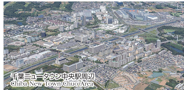
千葉ニュータウン中央駅周辺 Chiba New Town Chuo Area

北総線で都心へ直結し、日本橋まで最短約40分。大型用地の確保可能。しかも、地震に強い強固な地盤