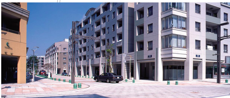
幕張ベイタウン(美浜プロムナード) 賑わいのある街並みを形成する幕張ベイタウンのメインストリート Makuhari Baytown (Mihama Promenade) Makuhari Bay Town's main street, forming a bustling cityscape.