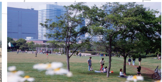
幕張海浜公園 写真の箇所は、幕張ベイタウンに隣接し、住民の憩いの場となっています。 Makuhari Seaside Park The area shown in the photo is a place of relaxation for residents adjacent to Makuhari Bay Town.