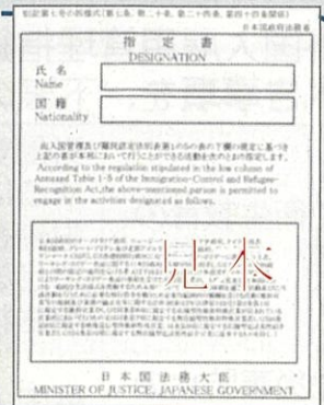
旅券に添付された指定書▶

在留資格が「特定技能1号」、「特定技能2号」の場合には分野を、 在留資格が「特定活動」の場合には活動類型を、 旅券に添付されている指定書（右参照）でそれぞれ確認し、 下表のうちいずれかを、在留資格欄に記入してください。