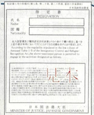
旅券に添付された指定書▶

在留資格が「特定技能1号」、「特定技能2号」の場合には分野を、 在留資格が「特定活動」の場合には活動類型を、 旅券に添付されている指定書(右参照)でそれぞれ確認し、 下表のうちいずれかを、在留資格欄に記入してください。