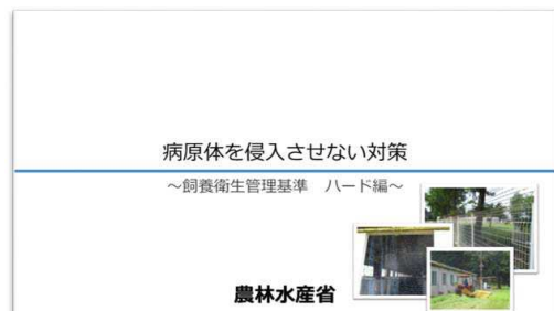
「病原体を侵入させない対策」