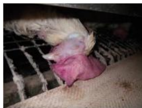
鶏冠等の浮腫・チアノーゼ

家きんの特定症状 (1日の死亡率が過去3週間の平均の2倍以上) を念頭に健康観察を実施。 異状があればすぐに家畜保健衛生所に通報。