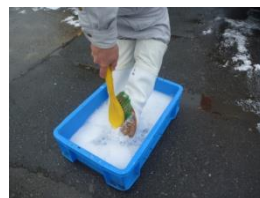
踏込み消毒 消毒槽点検