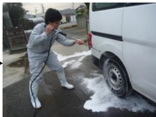
車体消毒 (特にタイヤ・荷台)