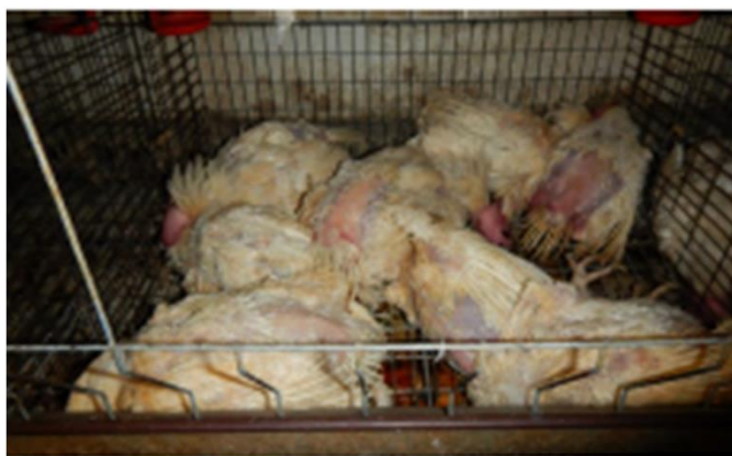
同一ケージ内での死亡