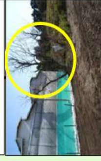
家きん舎周囲の樹木の剪定