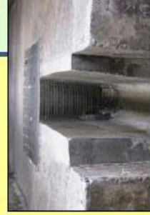
排水溝等からの侵入防止対策(鉄格子の設置)