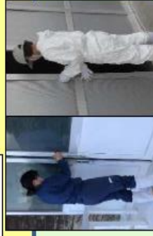
出入りの最小限化