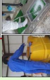
消毒液の定期的交換