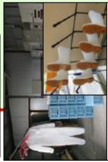
専用の服や靴の使用