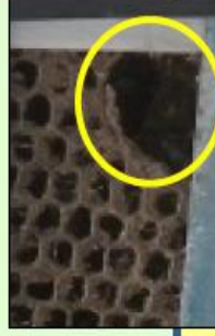
金網等の破損修繕