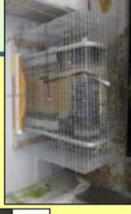
集卵・除糞ベルトの開口部の隙間対策