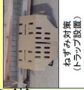
ねずみ対策(トラップ設置)