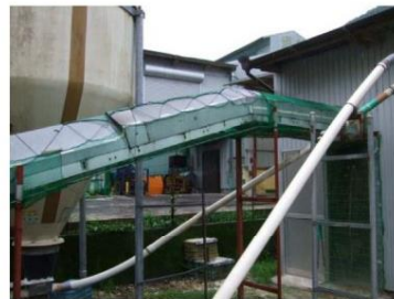
集卵ベルトや鶏糞排出口の 隙間