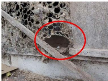
金網や防鳥ネット等の 破損