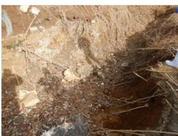
堆肥舎での卵や廃鶏の 放置による野鳥の誘引