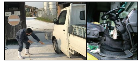
車両はタイヤだけでなく、 泥よけの内側まで消毒 し、 フロアマットの交換 や ペダル等車内も消毒