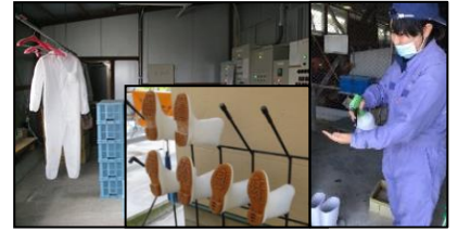
専用の服や靴の使用、手指消毒