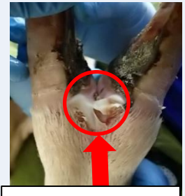
水疱が破れている