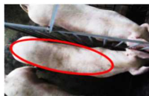
○識を付す場所（枠内）