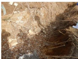
堆肥舎での卵や廃鶏の 放置による野鳥の誘引