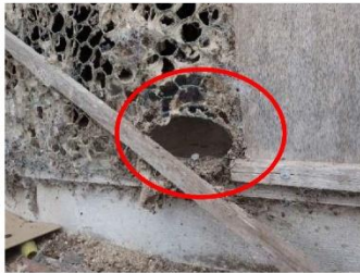
金網や防鳥ネット等の 破損