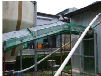
集卵ベルトや鶏糞排出口の 隙間