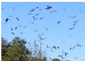
鶏舎周辺の野鳥の 住処等の除去