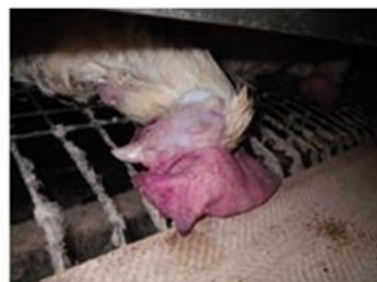
顔面・とさかの 浮腫・チアノーゼ←