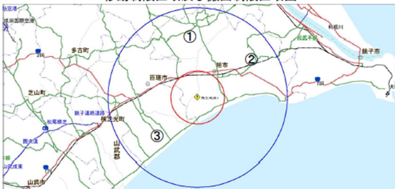
移動制限区域及び搬出制限区域図