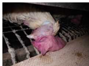
浮腫・チアノーゼ ← 顔面・とさかの