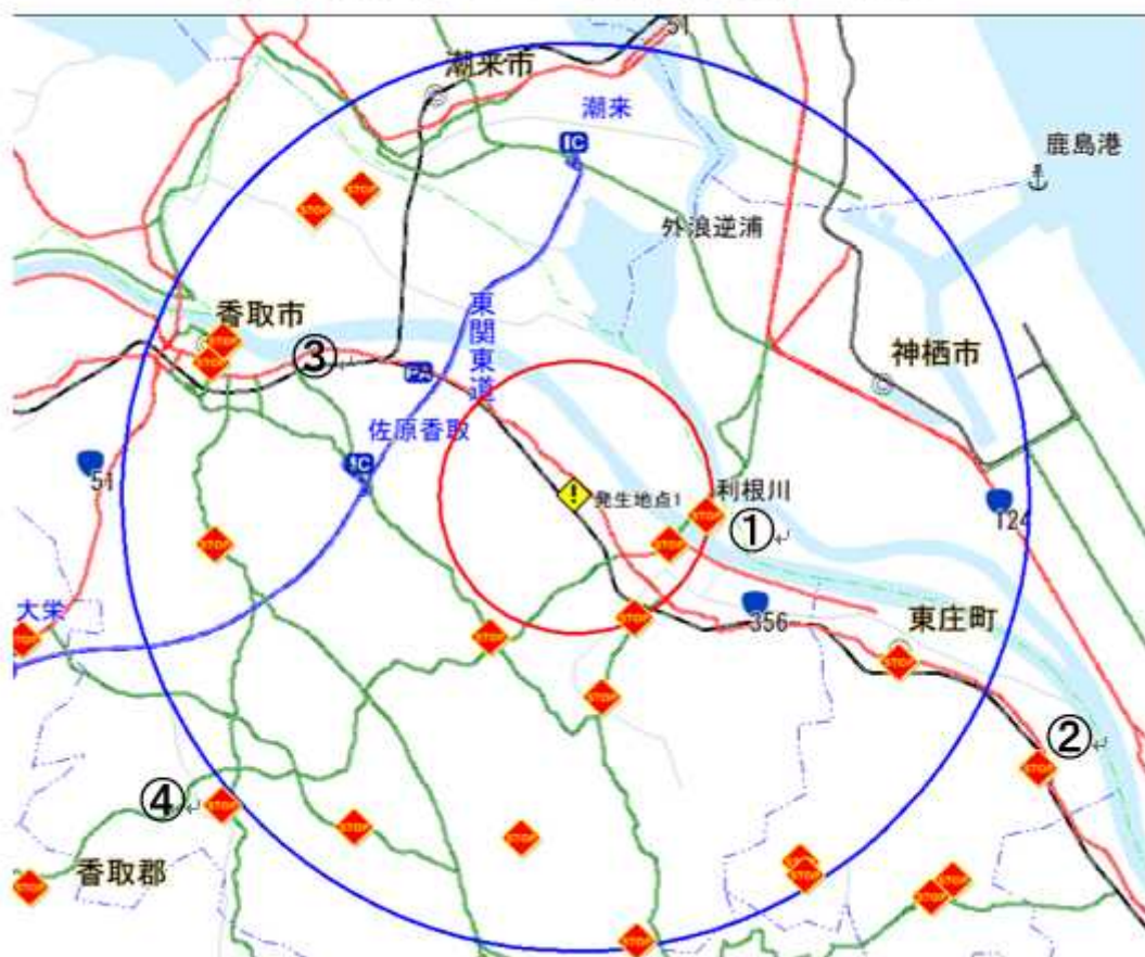
移動制限区域及び搬出制限区域図

付近の畜産関係車両は必ず消毒ポイントを通行し、車両内部を含め、厳重な消毒をお願いします。