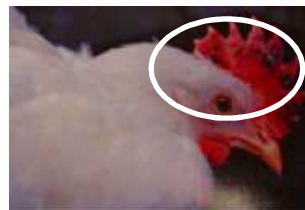
肉冠の出血・壊死