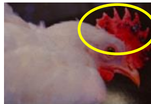
肉冠の出血・壊死