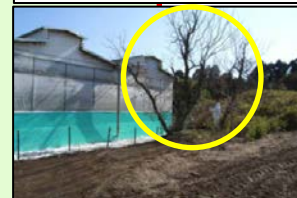
家きん舎周囲の樹木の剪定