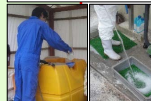
消毒液の定期的交換