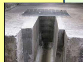
排水溝等からの侵入防止対策 (鉄格子の設置)