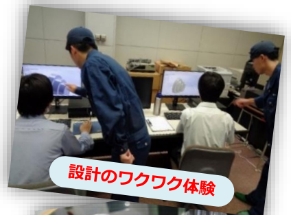
設計のワクワク体験