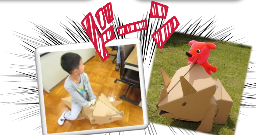
立って乗っても全然大丈夫です(^▽^)/