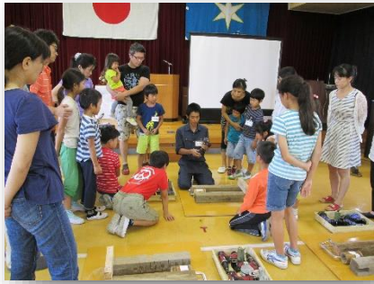
作り方の説明を真剣に聞いています