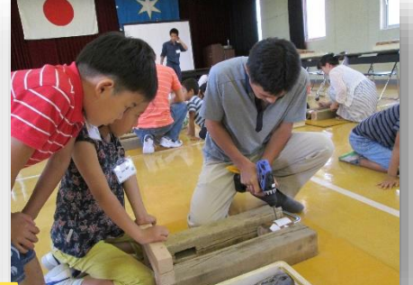
難しい所はお父さんも真剣です