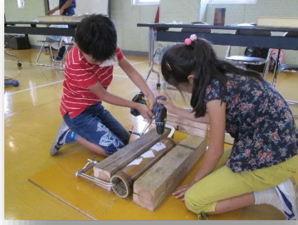
親子で姉弟で協力しながら作っています