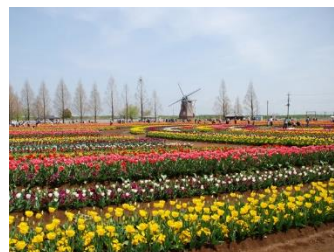
あけぼの山農業公園

航空会社所定の診断書を医師に書いてもらい、バッテリーを十分に用意した上で機内で呼吸器を使用し、沖縄に行った人もいる、とのお話もありました！