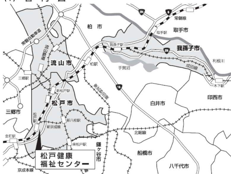
図3 - (1) 管内図

3 千葉県面積は平成21年版全国市町村要覧（総務省発行）に記載されている便宜上の概算数値による。