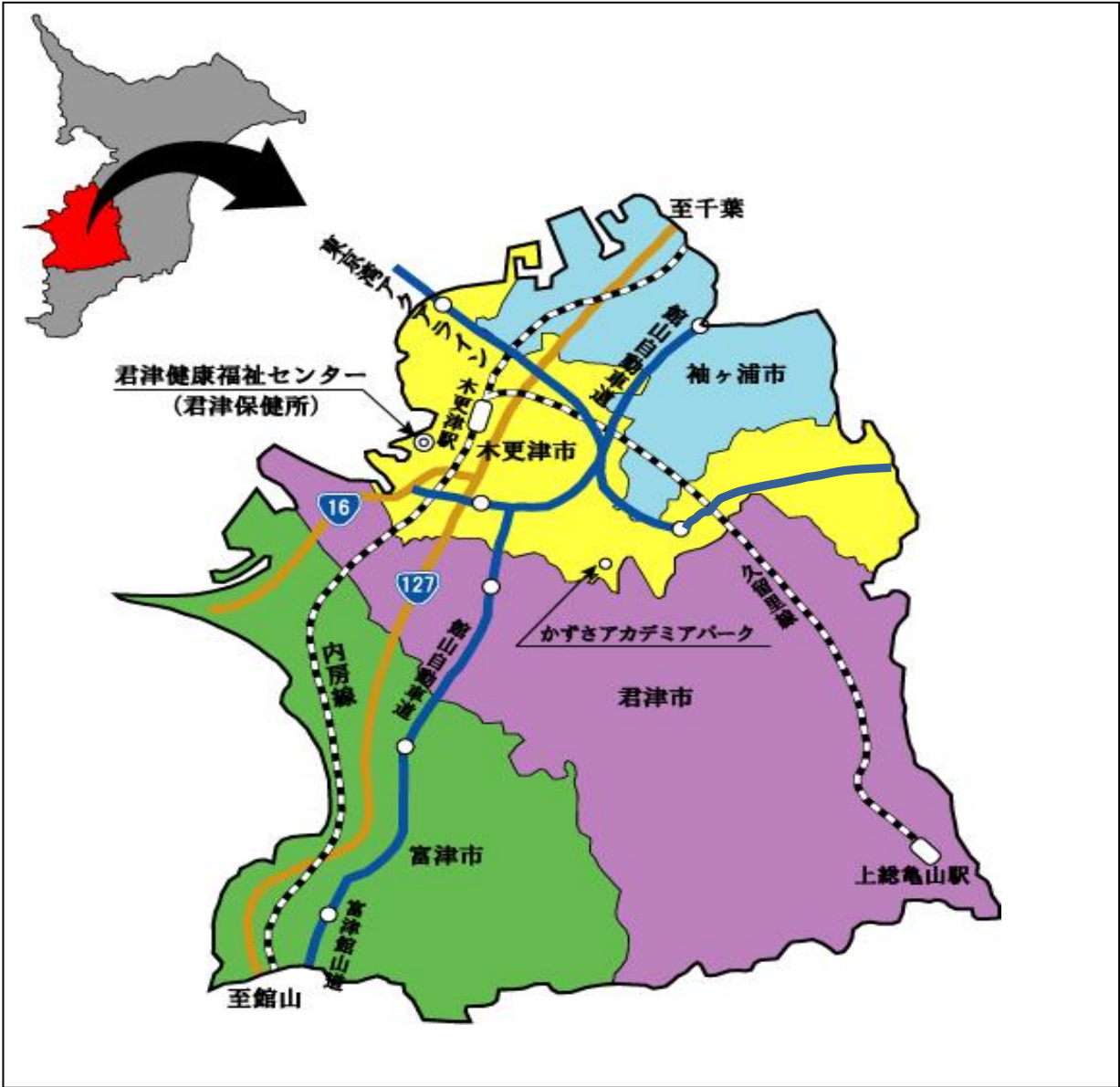
図 3－(1) 管内図

出典：(人口) 令和 3 年 10 月 1 日現在 千葉県毎月常住人口調査 (面積) 国土地理院 令和 3 年全国都道府県市区町村別面積調