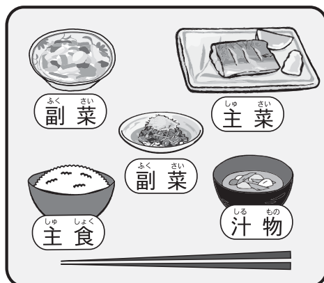
日本型食生活「配膳」図