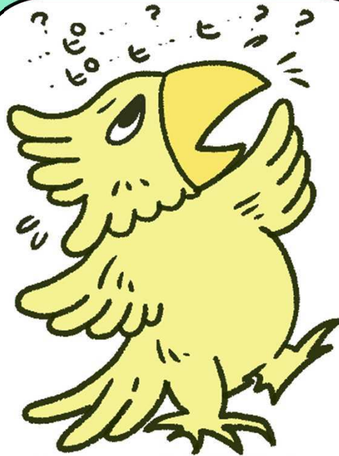
ろれつが回らない