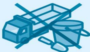
屋外に放置された 子供のおもちゃ