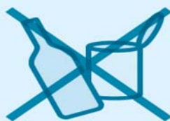
屋外に放置された 空きビン・缶、ペットボトル