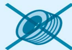
古タイヤに 溜まった水たまり