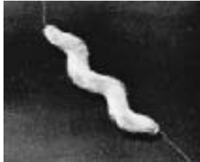
カンピロバクター電子顕微鏡写真

近年、食中毒菌の中でカンピロバクターによる食中毒が多く発生しています。 この原因の多くは、肉の生食や加熱不足です。 この菌の特徴を知って、食中毒を防ぎましょう。