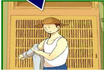
夷隅地域での発生状況