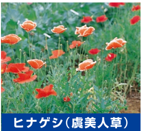
ヒナゲシ(虞美人草)