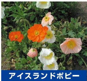
アイスランドポピー