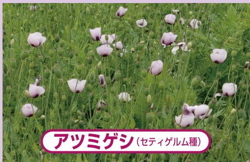
アツミゲシ (セティゲルム種)

花びら4枚で、色は赤、桃、紫、白などがあります。また、多数の花びらがついた八重咲きの花もあります。