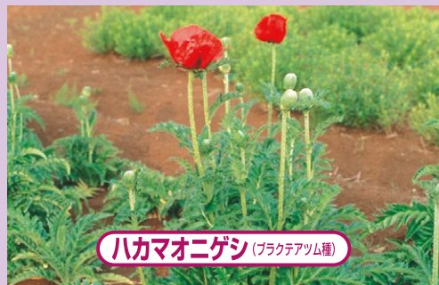
ハカマオニゲシ (ブラクテアム種)