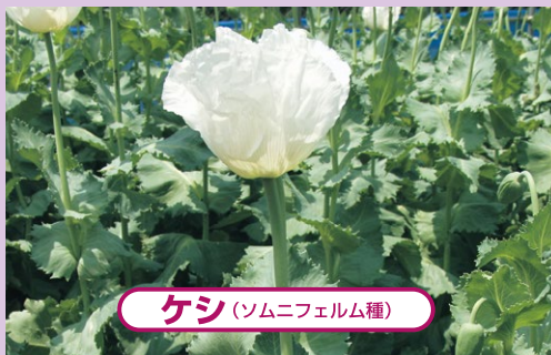
ケシ (ソムニフェルム種)