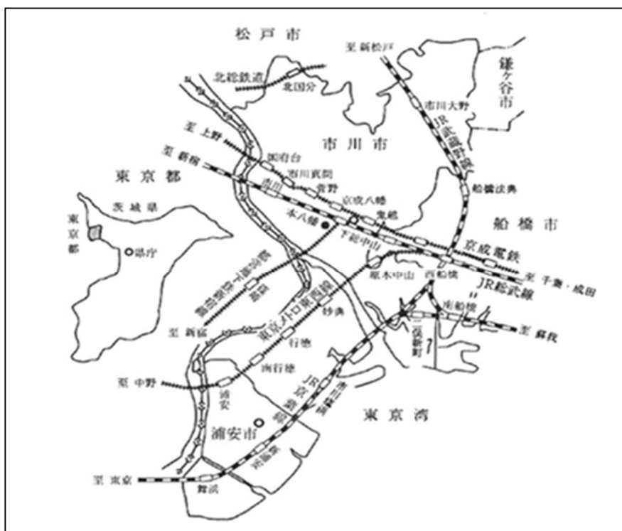
図3- (1) 管内図