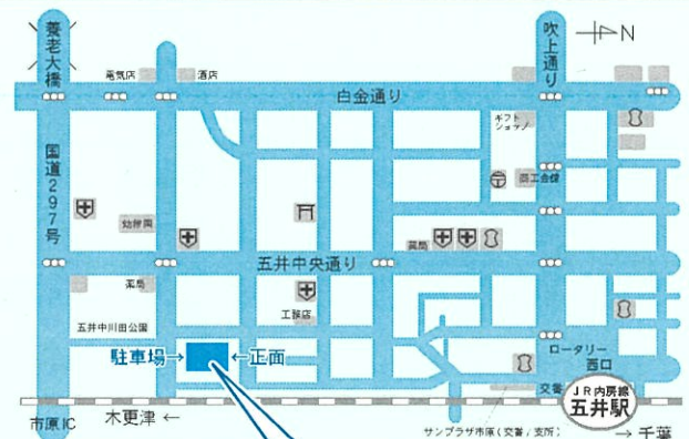
千葉県市原健康福祉センター(市原保健所)

ホームページ http://www.pref.chiba.lg.jp/kf-ichihara/index.html