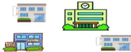
かかりつけ医機能を担う医療機関

外来機能報告を踏まえ、地域の協議の場において協議を行い、医療資源を重点的に活用する外来（紹介受診重点外来）を地域で基幹的に担う医療機関として、都道府県が公表した医療機関。