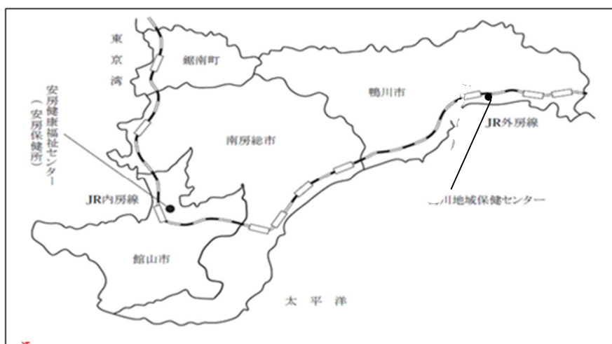
図 3 - ( 1 ) 管内図