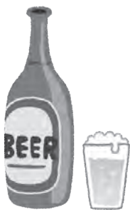
ビール(平均5%) 中瓶1本(500ml)

厚生労働省の指標では節度ある適度な飲酒は、1日平均純アルコールで20g程度の飲酒とされています。純アルコール20gは目安として下の絵のどれか一つになります。