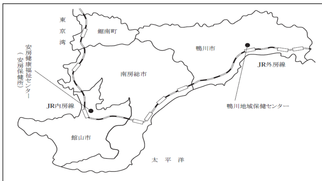
図 3 - (1) 管内図