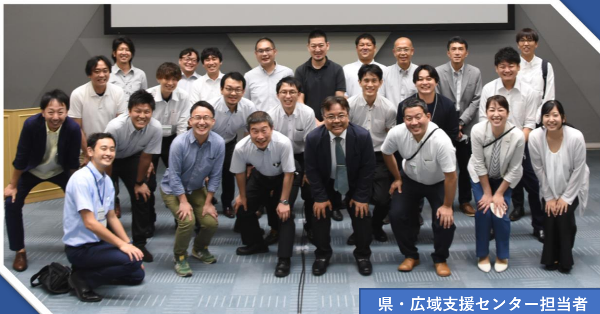
県・広域支援センター担当者

千葉県では、二次保健医療圏ごとに1箇所指定している、「地域リハビリテーション広域支援センター」の支援機能を充実させる役割を担う機関として、 「 ちば地域リハ・パートナー 」を指定しています。