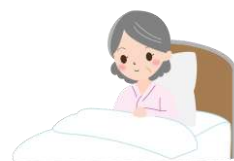
最悪の場合 寝たきりの状態に…