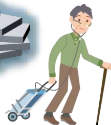
常時酸素ボンベが 必要なことも…