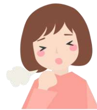
長期間続く咳や痰