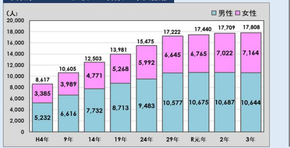
千葉県のがんによる死者数の年次推移