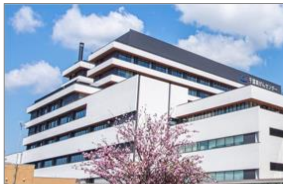
千葉県がんセンター

患者や家族の相談にワンストップで対応する患者総合支援センターも設置しており、患者等の利便性の向上を図るなど、県がん医療の中核的な施設となっています。