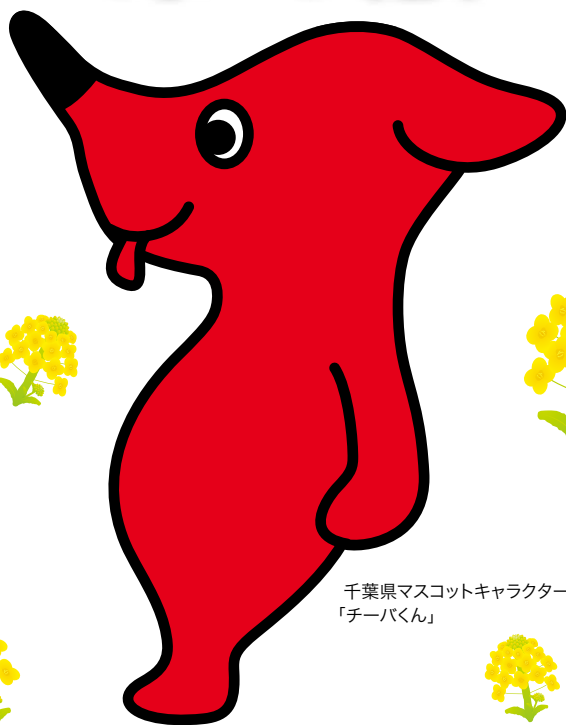
千葉県マスコットキャラクター 「チーパンくん」