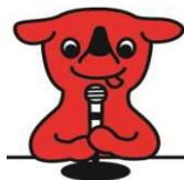
千葉県マスコットキャラクター

https://www.pref.chiba.lg.jp/kenfudou/nyuu-kei/kensetsukouji/ki-tei-tsuuchi/shiori/index.html