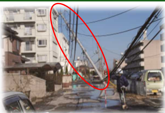
(東日本大震災)