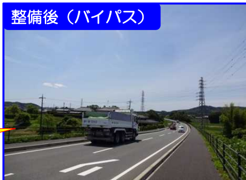
年間平均事故件数 (西原・馬来田工区)